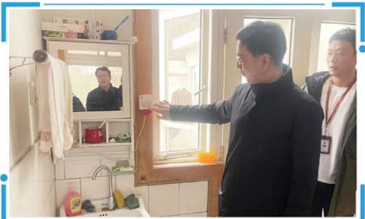
检查居民家中一氧化碳报警器是否安装到位。