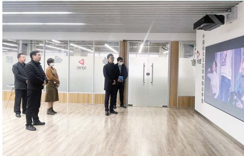
参观企业展厅并听取安全生产情况介绍。