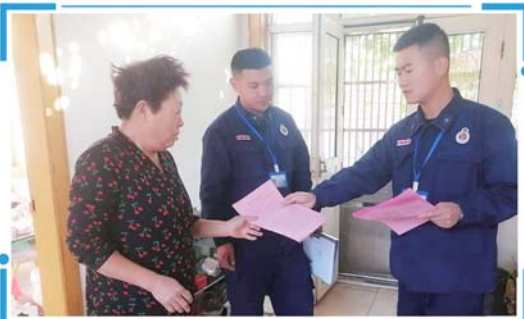
微型消防站工作人员向居民发放一封信。