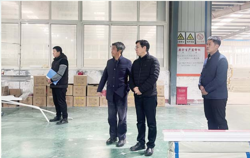
查看企业生产车间。