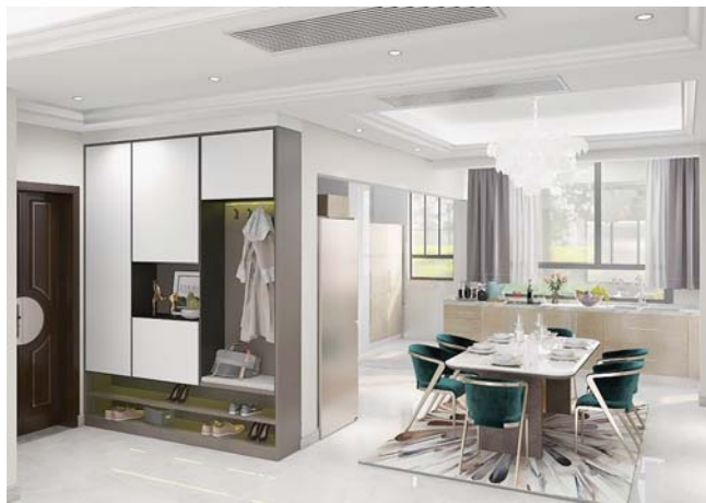
业主家装修效果图。