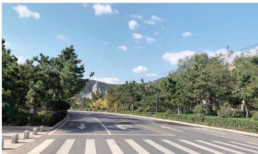
《最美流清湾》段女士