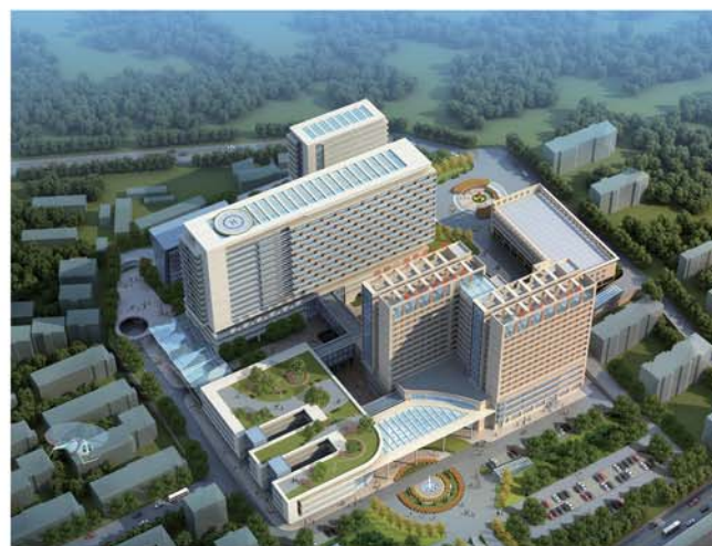
青州市中心(肿瘤)医院二期效果图。

8月18日,青州市公共卫生临床中心项目开工。中心建成后,以青州市中心医院为依托,将坚持平战结合、防治融合的原则,聚焦新冠肺炎疫情暴露的公共卫生特别是重大疫情救治能力短板,担负青岛及周边地区的突发公共卫生事件的应急处理和诊治。