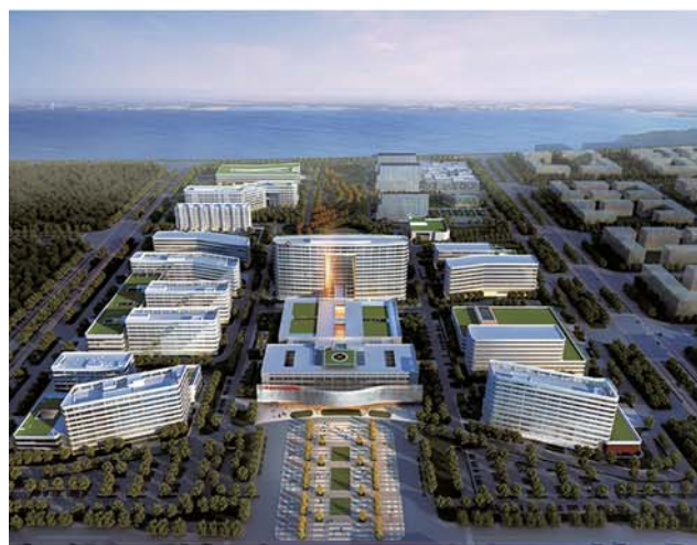
青州市公共卫生临床中心效果图。