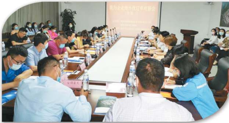
“我为企业海外找订单”对接会。

则，充分尊重企业意愿，坚持双向选择，确定被辅导企业与辅导队的搭配，第一批以民营小微企业为主，共筛选50家企业作为辅导对象。