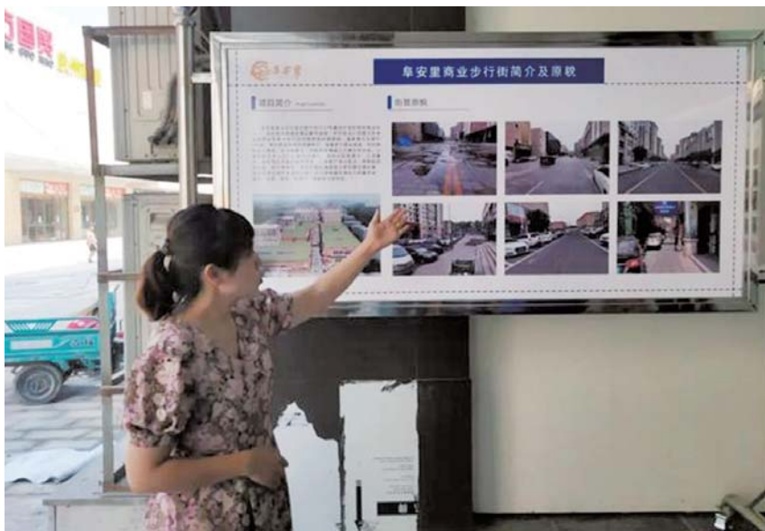
阜安里商业步行街。