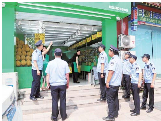
开展市容秩序规范整治。