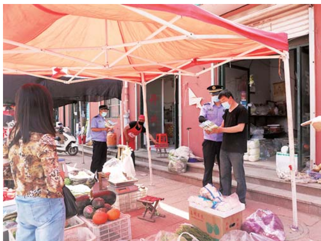
采取柔性执法宣传引导商户依法有序经营。