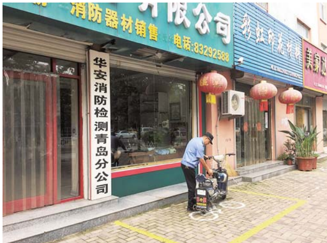
划定非机动车停放区域并规范停放。