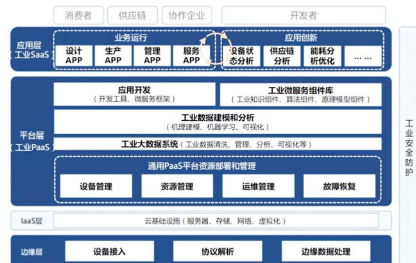
工业互联网平台功能架构图。