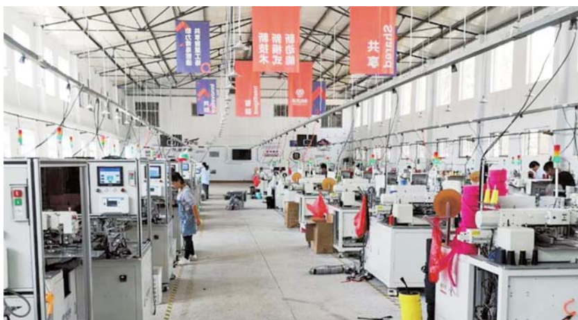
共享工场接单生产。

除提供租赁服务外,共享工场从自身核心产品能力出发构建工业互联网平台C2B2B2C生态系统为载体为信息化水平不高、智能化转型需求迫切的制造