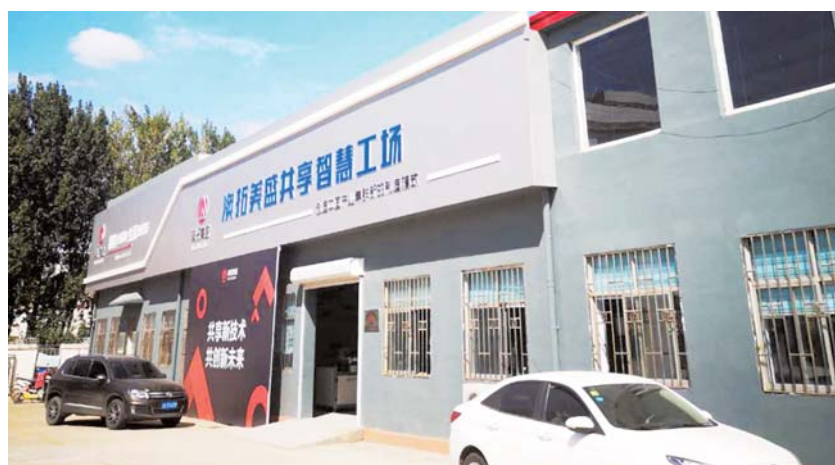
共享工场,共享新技术。