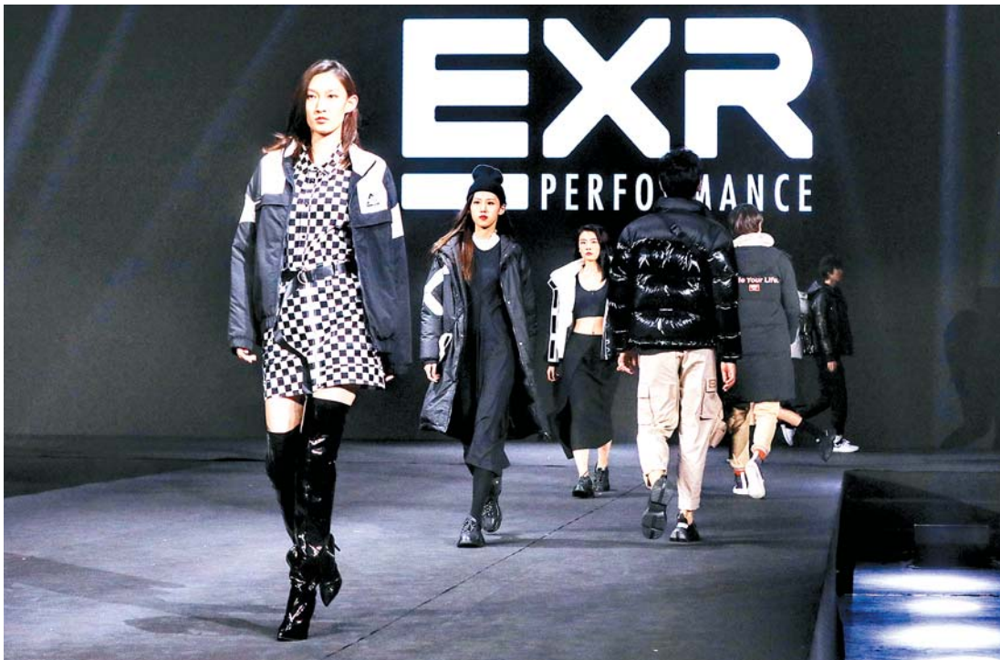
模特们展示赛车运动品牌时装。