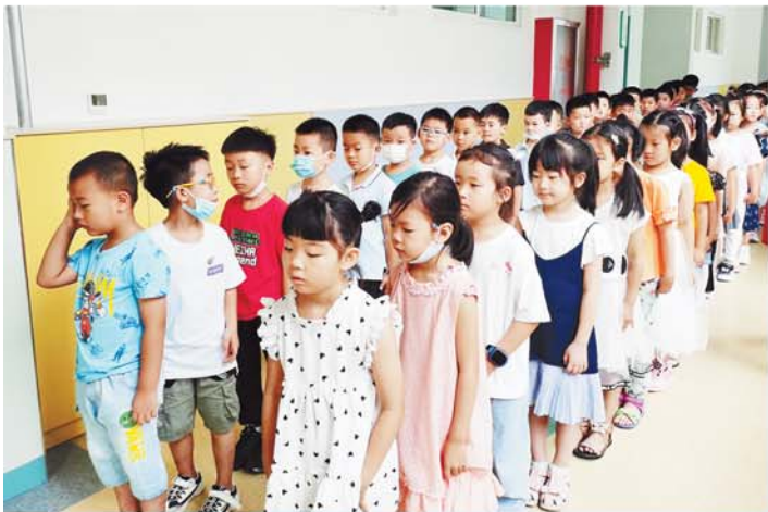
青岛二中院士港分校萌娃入学报到。