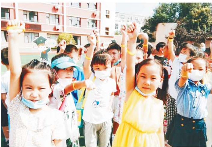
北山二路小学新生展示手环。