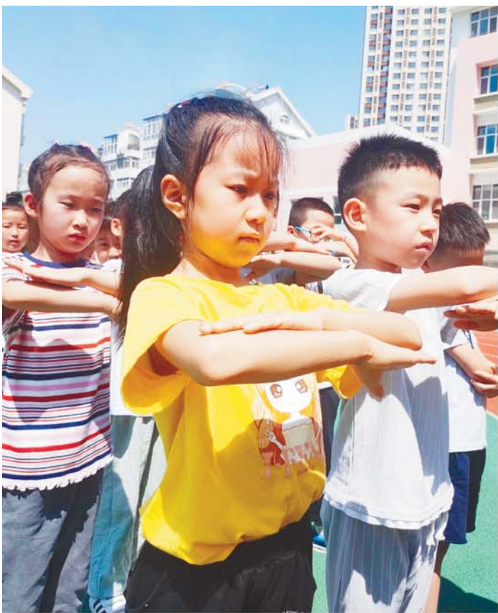
宁安路小学新生第一天学规范。