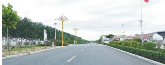
乡村振兴示范线沿途道路硬化等工程建设不断升级。