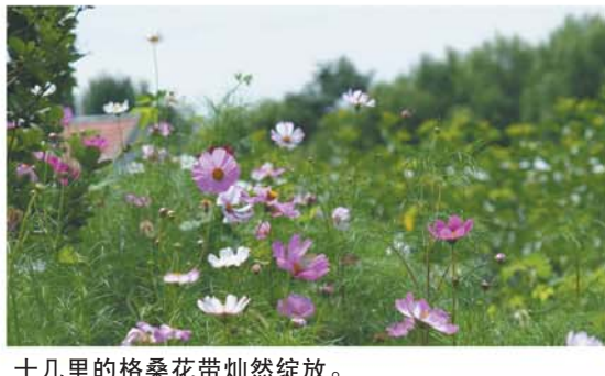
十几里的格桑花带灿然绽放。

以立博一期及总投资5亿元的立博汽车涡轮增压器壳项目为支撑的年产值10亿元的汽车零部件项目。