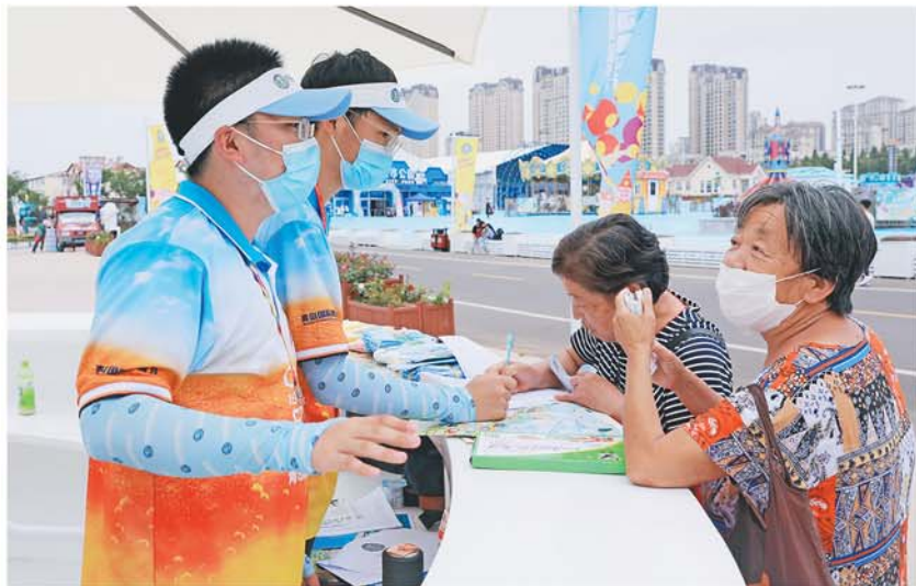
游客正在学雷锋志愿服务站咨询。

余块LED大屏幕循环播放第30届青岛国际啤酒节宣传片、疫情防控信息等，此外啤酒节期间，还在金沙滩啤酒城的8个入口以及整个园区内，循环播放疫情防控须知，提醒市民游客做好疫情防护，合理佩戴口罩、安全聚餐等。