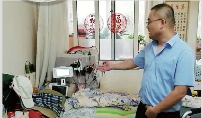
安装在老人床头的居家养老服务终端和智能网关,老人在遇紧急事态时可一键求助。