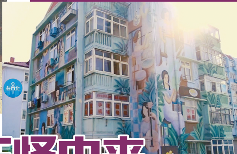
17幢居民楼的6万多平米彩绘。