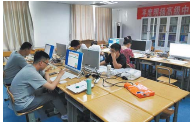
为老师配备培训用的电脑。