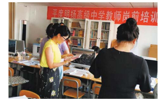
老师们借阅教育专著。