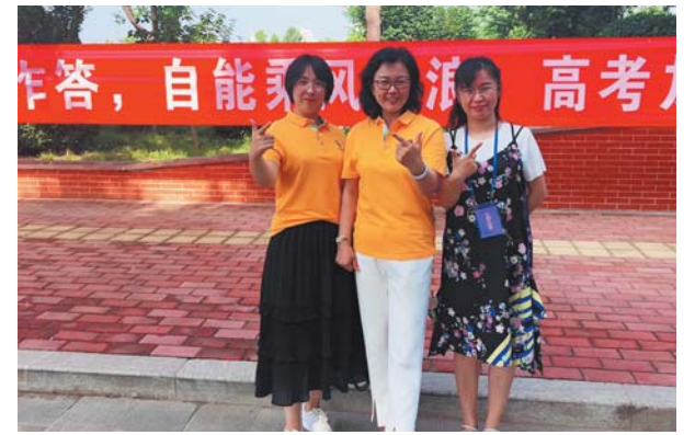
跟岗培训的明扬老师和九中老师一起为高考生加油。