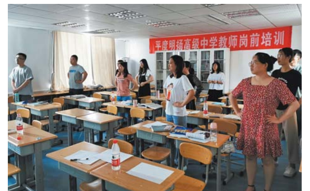
明扬教师培训发声及表达技巧。