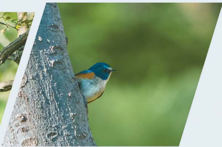
▲一只红胁蓝尾鸲(音同渠)跟记者玩起了捉迷藏。