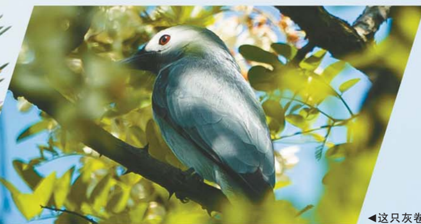
◀这只灰卷尾的眼神是不是“犀利”?