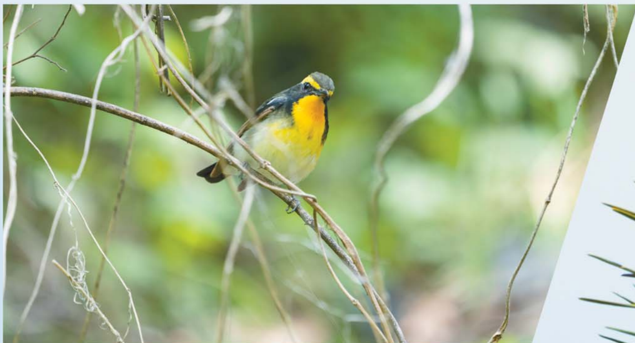
▲面对记者的镜头,这只黄眉姬鹟(音同翁)很淡定。