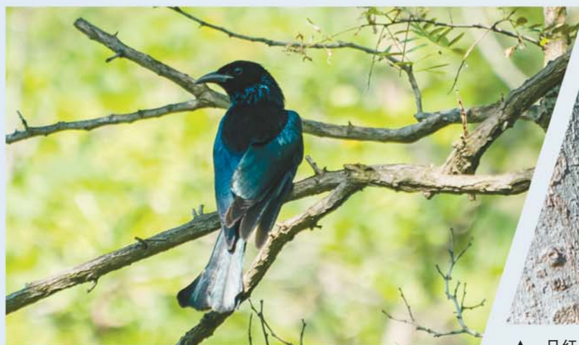
▼因头上长有“小辫子”而得名的发冠卷尾。

请允许记者先卖个关子,接下来记者将结合自然、地理、人文、历史等等,在半岛新闻客户端分20篇左右,讲讲鸟的故事与拍鸟的故事,权当为青岛候鸟立传吧。如果您曾拍到珍稀、有故事的鸟,您可以通过半岛新闻客户端找记者栏目或者加记者微信(lbming125)联系,咱们一起为青岛候鸟来个别样科普。鸟类知识繁杂且专业,如有失误之处,请您指正。