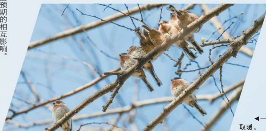
◀一群白喉长尾山雀聚在一起取暖。