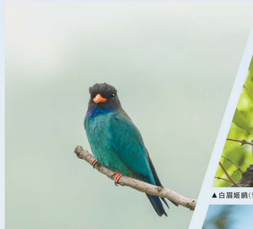
▼青岛比较罕见的三宝鸟。