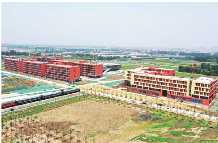
山东文化产业职业学院。