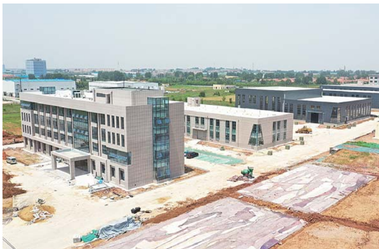
高端装备润滑材料创新中心。