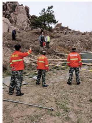
护林员及时劝离上山游客。