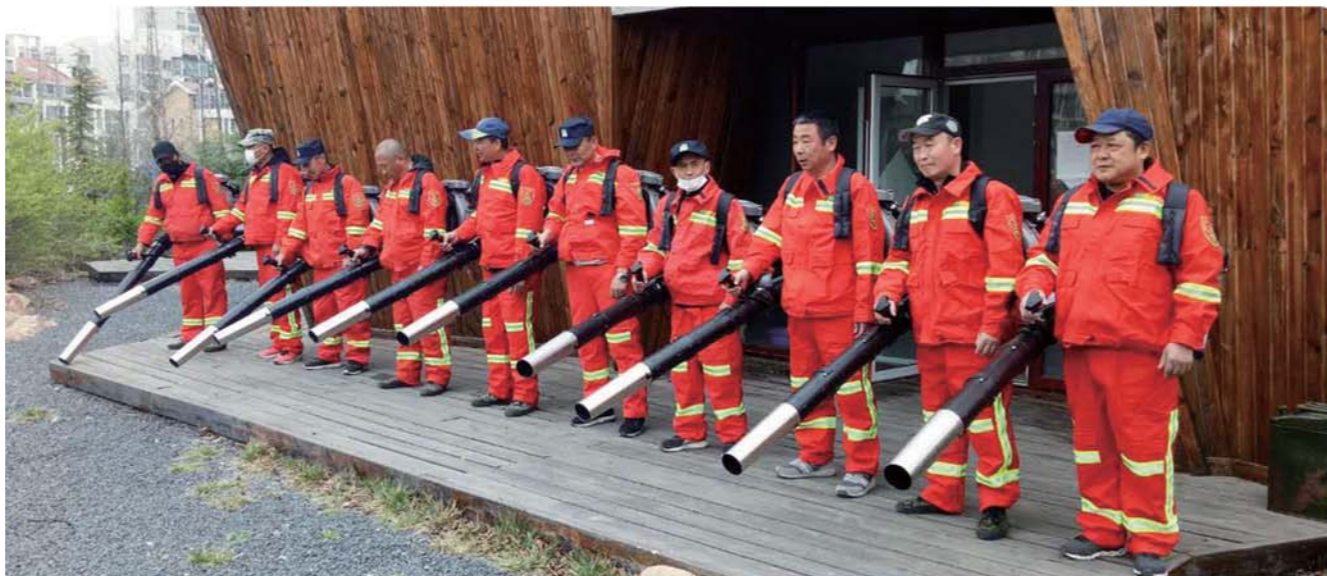
大埠东社区新增的防火设备。