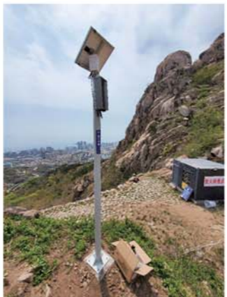
街道在山上设置的语音警示器。