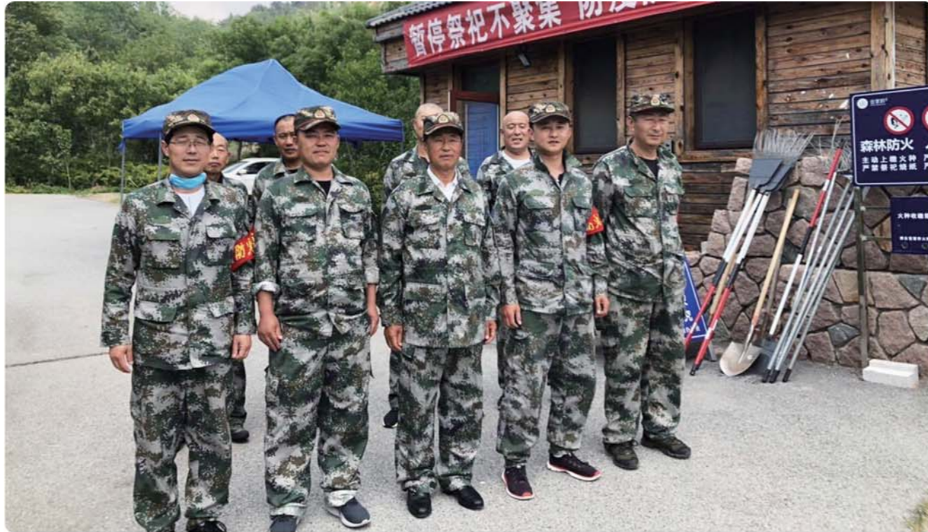
王家麦岛社区“两委”与护林员一起守护山林。