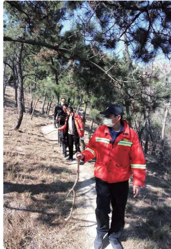
护林员不畏辛苦坚持巡山。