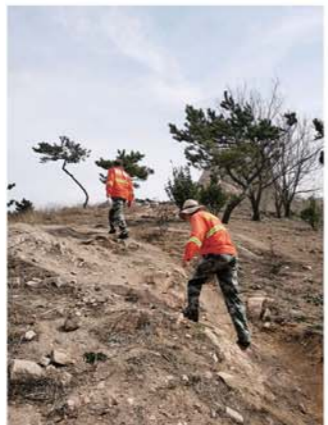
社区护林员不间断巡视山林。