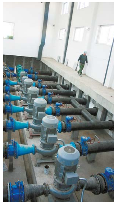
新投入使用的市北水厂泵房。