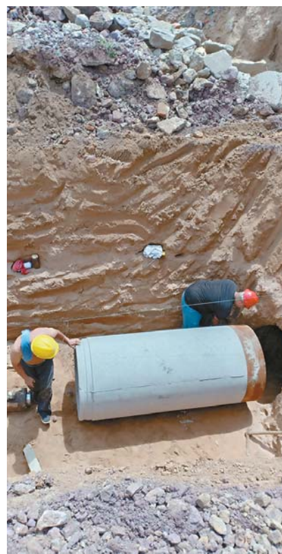
施工人员正在实施营流路供水配套工程。

抓好供水保障,抓好水质提升,抓好供水项目建设,抓好用户服务,抓好安全生产,贯穿这一系列中心工作主线,2020年,即墨区自来水公司将紧紧围绕区委、区政府“13456”总体发展思路,增强履行“三大责任”、践行“六大力量”的自觉性和坚定性,抓住国有企业改革的契机,以优质安全供水为中心,全面提高保障能力和服务水平,全力以赴服务全区经济发展。