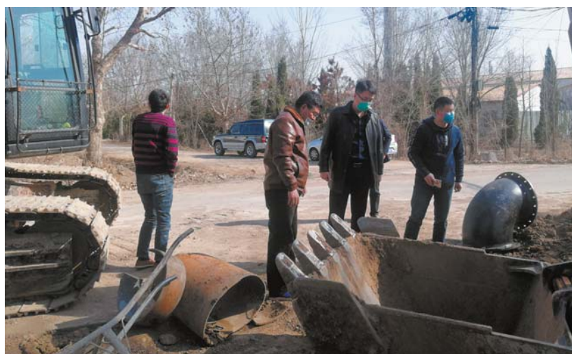
工作人员对工地进行安全隐患排查。