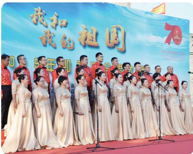
即墨区教职工“我和我的祖国”合唱比赛一等奖。