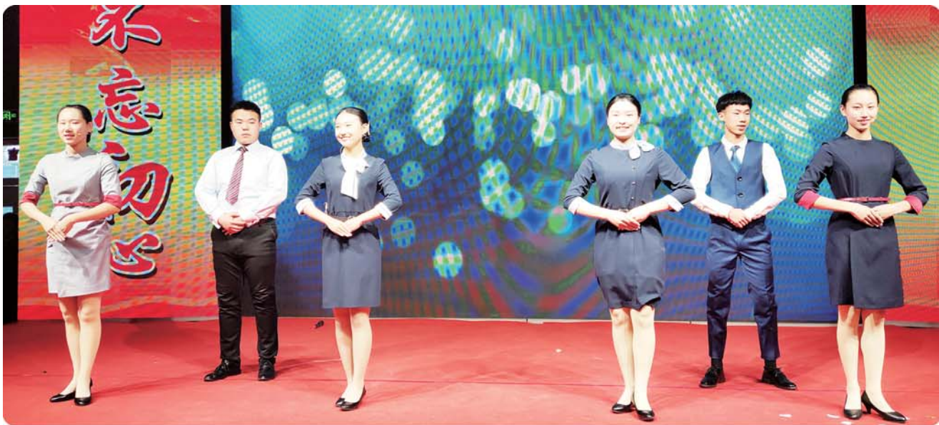
学生艺术节礼仪展示。