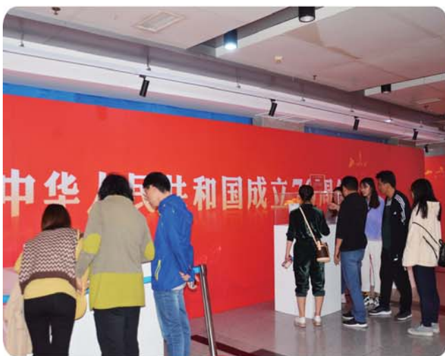
参观即墨区“庆祝新中国成立70周年发展”图片展。