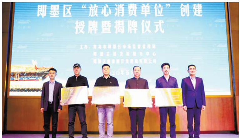
党员示范单位授牌。