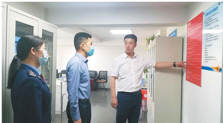
环秀所开展家具放心消费示范街创建。