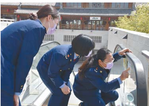
古城所在检查消费场所电梯安全。

近日,即墨区市场监管局“放心消费单位”创建授牌暨揭牌仪式在即墨古城学宫举行,共授予4名街长牌和2名党员示范商家示范创建牌,来自古城的商家和区餐饮协会理事单位代表及监管执法人员120余人全程参加活动。据悉,“放心消费单位”拟创建总数为4049家,第一批在“放心消费在青岛”网站注册公示,录入平台并审核通过1915家。