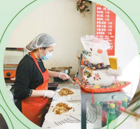
老板正在制作芙蓉蛋卷。