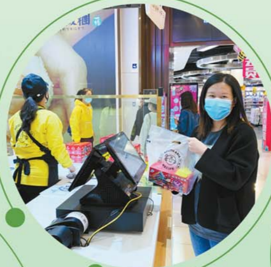
来南洋大师傅购买蛋糕的顾客。