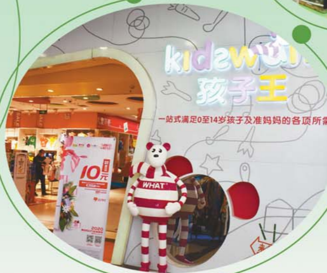
万达孩子王有不少优惠。