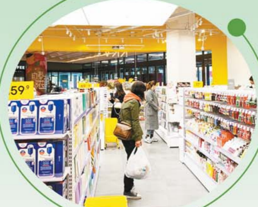
顾客在KKV里选购商品。