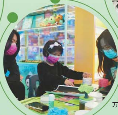
万达宝贝王店里好玩的很多。