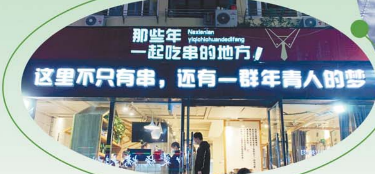
来“那些年 一起吃串的地方”撸串。