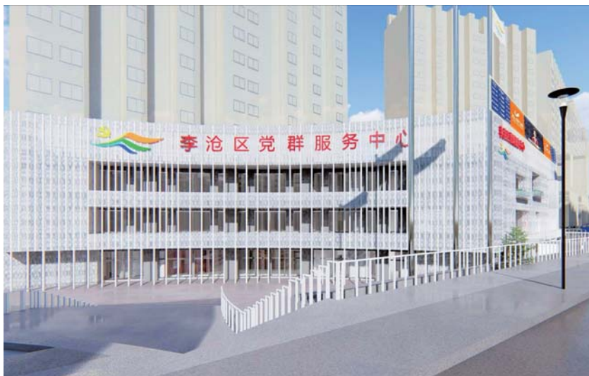
浮山路街道党群服务中心效果图。

走进一楼是便民服务大厅,为居民打造“一站式”的服务平台,实现“一站式服务、窗口式办公”,方便了辖区居民,大大提高办事效率。服务大厅背后是浮山万象展厅,一进入该展厅,仿佛穿越时空隧道,展厅承载着浮山路街道近年来的历史,以讲述与浮山路街道辖区村落