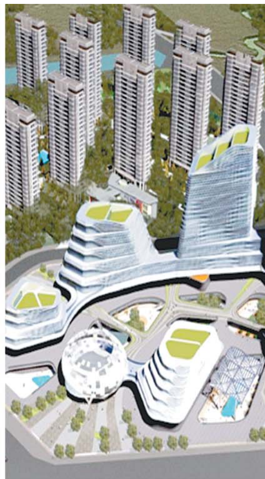
启迪三螺旋项目规划示意图。