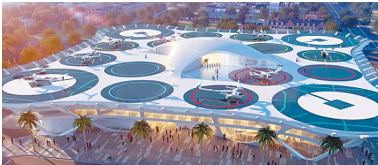
无人机产业园项目规划示意图。

网络青岛机器人总部项目计划总投资10亿元，将建设全国领先的机器人超脑中心、技术创新中心、机器人生产基地、国家级机器人产业人才培养基地、人工智能机器人综合体验基地；北斗华辰导航技术项目计划总投资5亿元，将推动我国轨道交通的产业升级，提高轨道平顺性监测的效率，计划2024年实现上市。