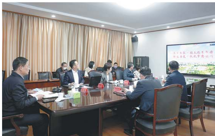
三年行动计划项目发布及集中签约仪式。