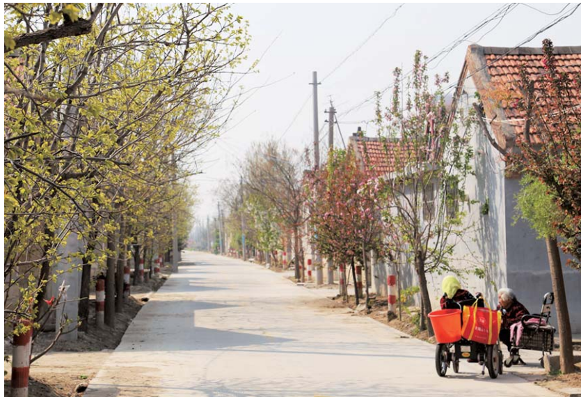
村民坐在路边聊天。

日常保洁，定人定岗。全镇286名保洁员，实行“定人、定岗、定区域、包卫生”工作机制，对村庄房前屋后、背街小巷、卫生死角等区域开展常态化清扫保洁。垃圾清运，日产日清。探索垃圾分类新模式，对开展垃圾分类的43个村庄实行户分类、村收集、镇清运，积极引导居民在规定时间内、地点投放垃圾，分类收集，定时清运，同时清运作业完成后做到车走地净。监督管理，即查即改。加强与保洁公司沟通，每月召开例会，总结分析部署。每天巡回督查，对发现问题拍照上传工作微信群，及时通报，限时整改，并上