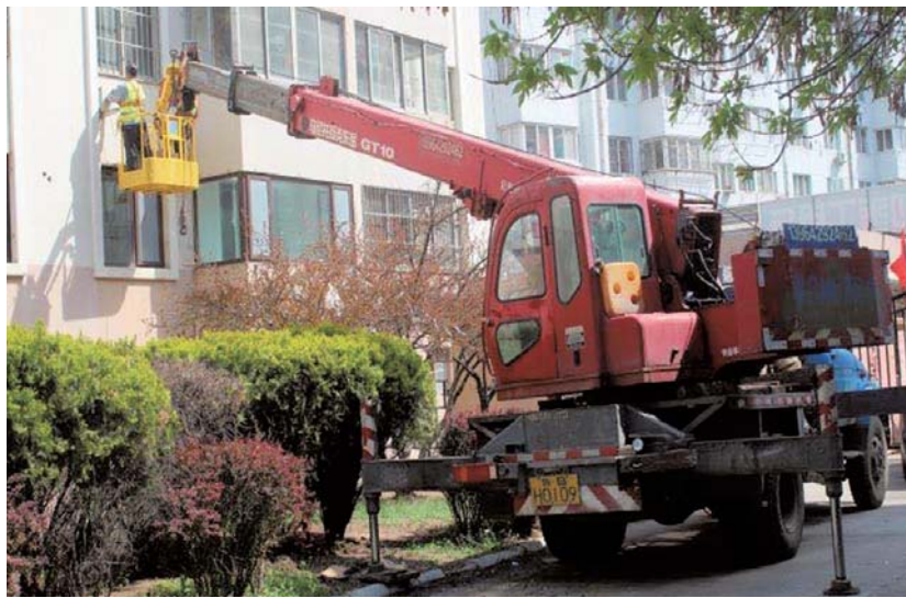
拆除防盗窗和太阳能。

为了确保整治改造工作顺利推进,中云街道成立由主要负责同志任组长、各相关责任部门为成员的临时指挥部,安排专门人员提前进场办公,同时积极对接供热、供电、自来水、各