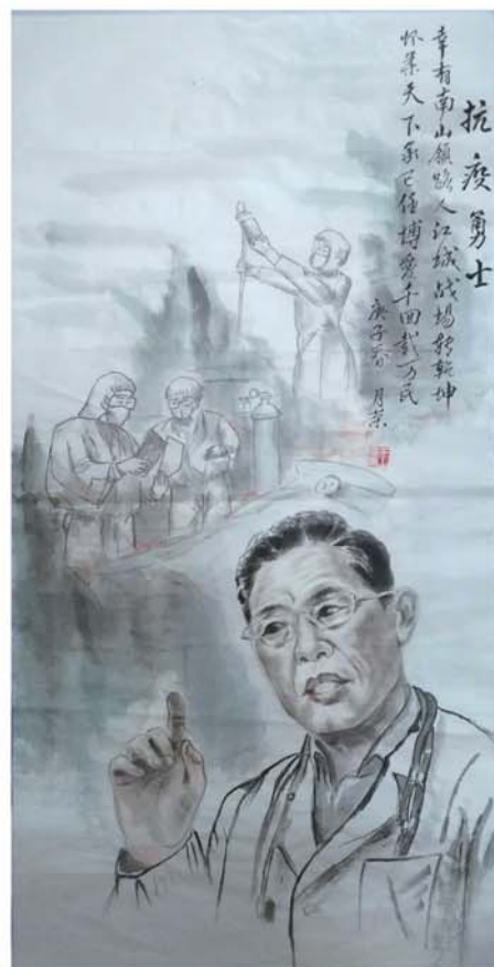
《抗疫勇士钟南山》 创作居民: 侯家庄社区居民王月荣