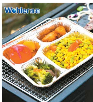
公司生产的部分环保餐盒。