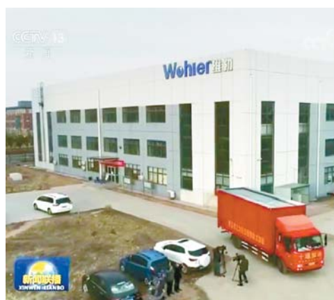
援助方舱医院餐盒紧急发往湖北。

作为一种在欧美国家已经流行多年的包装形式,铝箔包装早已成为西方国家的居家必备品。此次疫情以来,随