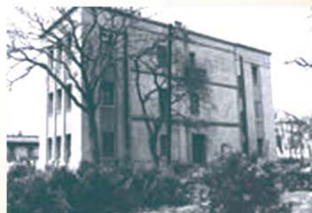
广西路14号青图大楼。