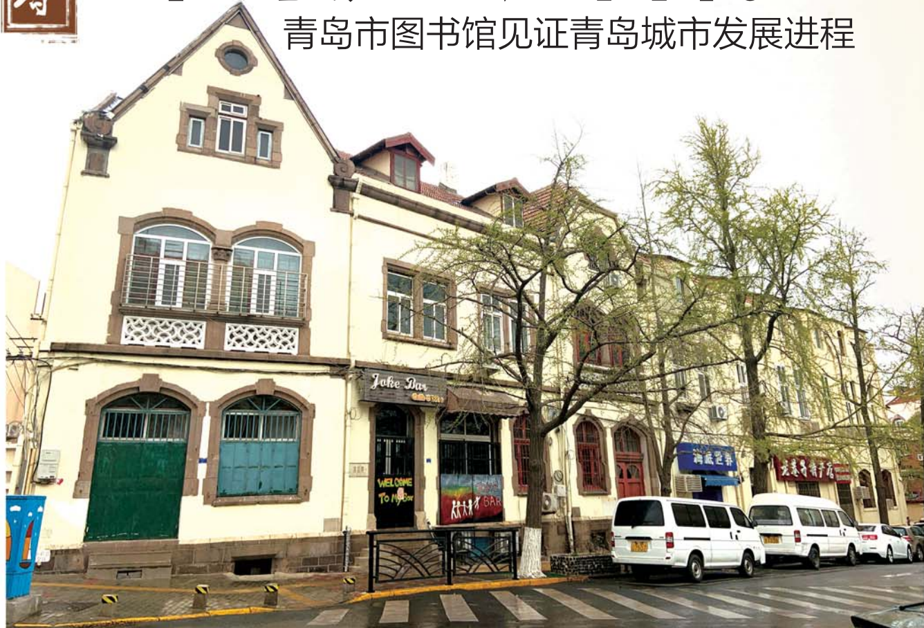
莒县路2号