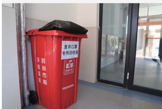
二中分校还准备了废弃口罩专用回收箱。