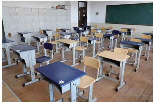
二中分校教室内课桌间隔一定距离,并编号。