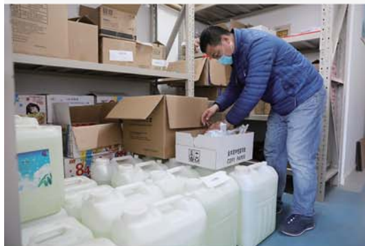
二中分校储备了充足的口罩、酒精等防疫用品。