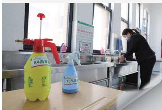
二中分校餐厅内准备了消毒液和酒精。