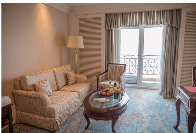
酒店房间舒适温馨。