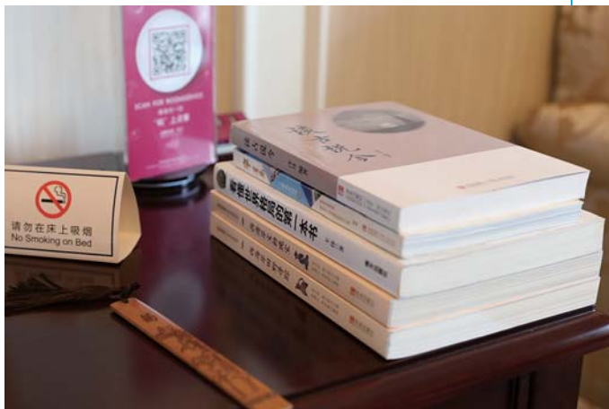
酒店房间内准备了休闲书籍。