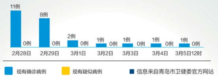
一周来全国确诊及疑似病例变化图