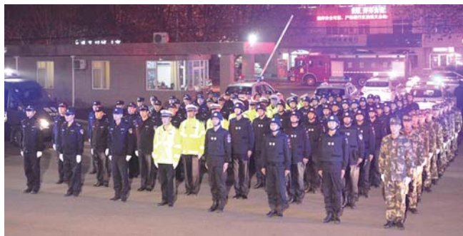
秋冬严打打出警仪式。

为优化社会治理机制、提升社会治理能力、健全社会治理体系，探索打造具有时代特征的社会治理新模式，用实实在在的治理成效力保群众平安、赢得群众满意、增添群众幸福，根据青岛市公安局的统一部署，自2019年9月底起，莱西市公安局在全市发起声势浩大的秋冬严打整治攻势，连续开展“雷霆系列”行动，截至目前，共查获各类违法犯罪嫌疑人830余名，追捕逃犯68名，化解矛盾纠纷420余起，以实际行动打出了声威，打出了气势，赢得了民心，有力推动了平安莱西建设向纵深发展。