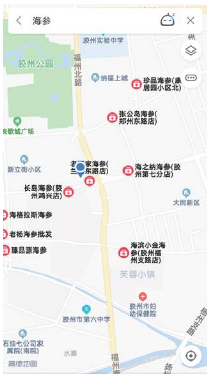
网上搜到的周边海参店。

“我印象中是从非典以后,大家都突然开始重视身体健康,养生意识比较强,所以买海参的越来越多。无论自己家人食用还是作为礼品送人,都很实用。”