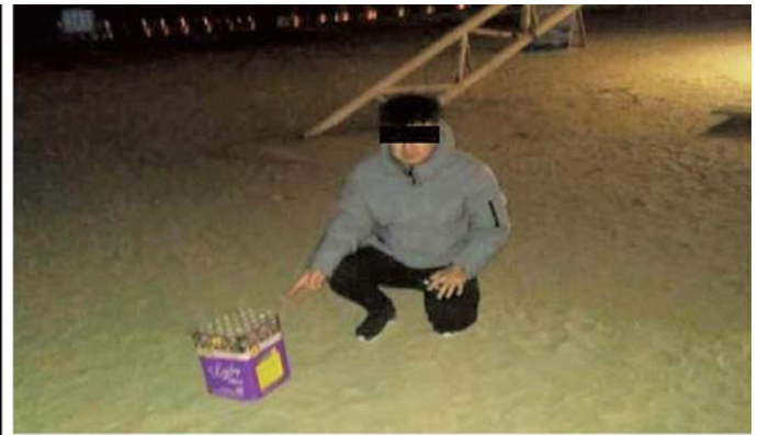
蒲某津被处以罚款500元的行政处罚。