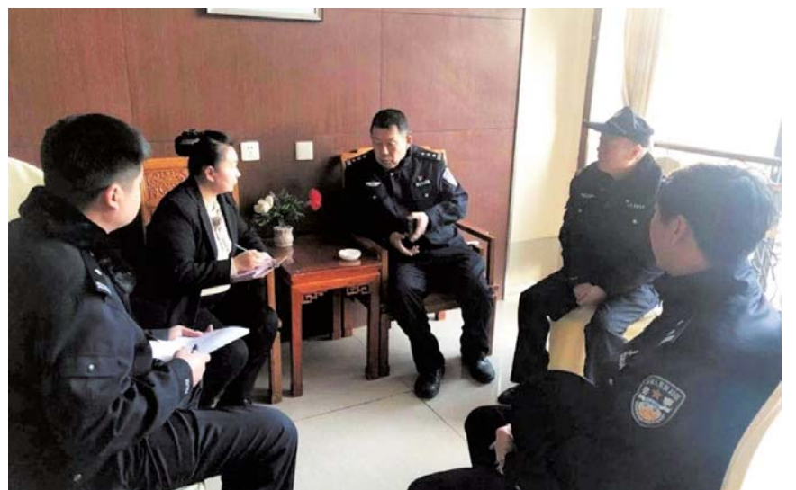
“百万警进千万家”，把平安幸福守护在群众身边。

走进群众家中，听民声、察民情、访民意，分情分类做好不同群体的走访活动，把“温暖、服务、帮扶”送到家，用实际行动展现党和政府的关心关怀。我们要走入群众心里，聆听群众反映的难点痛点堵点，落实各项便民利民措施，改进服务管理工作，让群众工作更省心、生活更