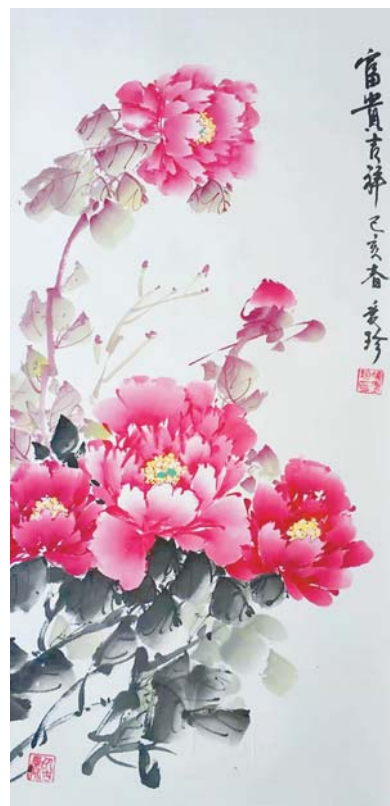
▶书画作品 天台路社区 凌爱珍

本报开设居民作品专栏,欢迎居民投稿,无论是书画作品、摄影作品还是文字作品,我们都欢迎您来投稿,投稿时需标注