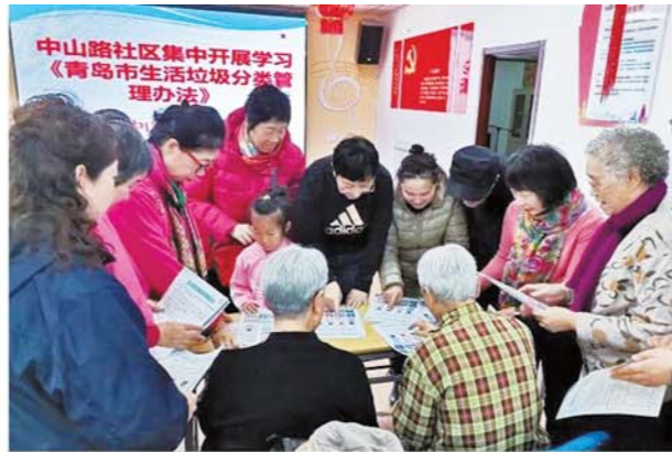
中山路社区开展垃圾分类宣传活动。