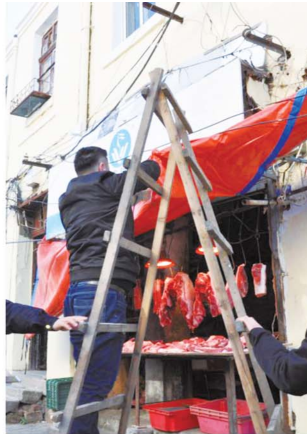
中山路街道整治黄岛路市场周边环境。