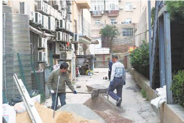
太平路社区整治问题楼院。