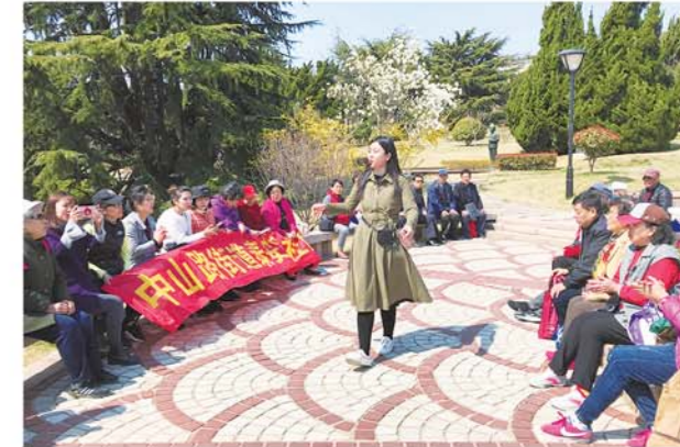
泰安路社区组织党员开展党建活动。