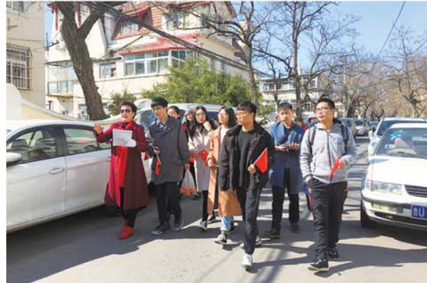
观海山社区志愿者宣传老建筑。