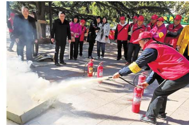
中山路街道开展消防宣传演练。