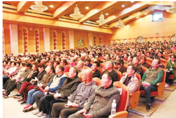
中山路街道举行“不忘初心、牢记使命”大党课。