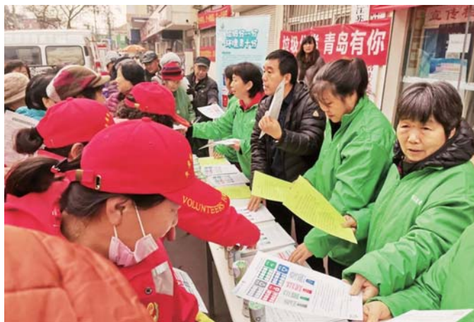
工作人员现场发放宣传资料。

活动现场,街道和社区工作人员结合上海、宁波、深圳等城市开展垃圾分类的先进经验及成果,向居民群众讲解开展垃圾分类的原因及重要性,现场详细解读《青岛市生活垃圾分类管理办法》,并根据实物形象讲解垃圾分类四分法,发放宣传彩页,让居民通过一张图就能读懂青岛生活垃圾分类新方式。活动还设立了“生活垃圾四分法,您掌握了吗?垃圾分类标准,您学会了吗?”等互动环节,激励居民深入了解垃圾分类办法。现场,工作人员还向居民发出落实《管理办法》倡议书,倡导大家积极参与垃圾分