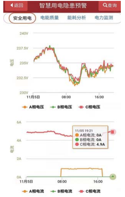
实时用电数据统计。