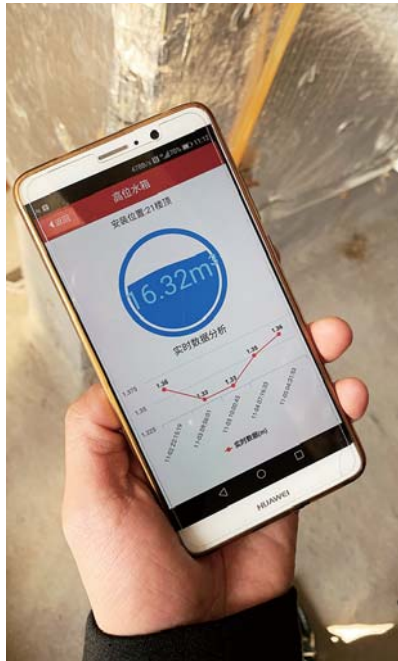
高位水箱实时数据分析。