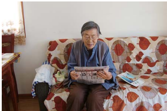
家里安装爱心门铃的老人在看报纸。