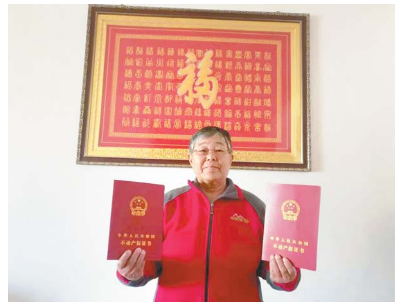
居民展示拿到的房产证。

因为双山馨城是旧村改造项目,需要主管部门确认拆迁居民身份。但是拆迁时间久远,这么多年过去了,拆迁居民家中人员也有很多变化,相当复杂,根本无法确认。