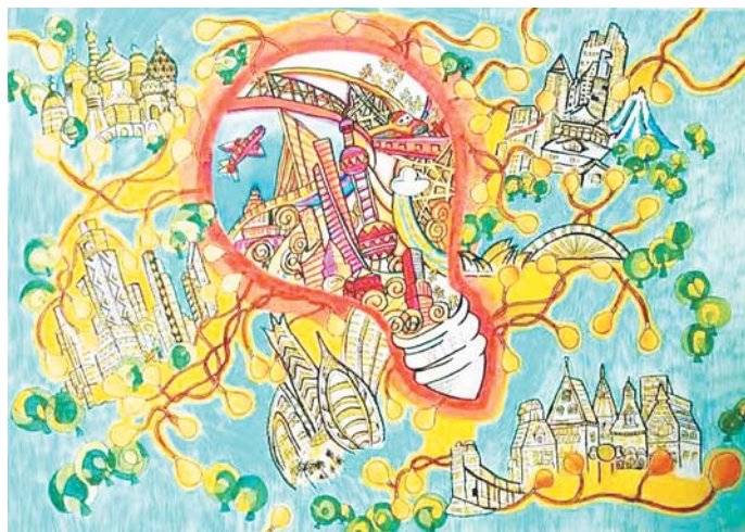
◀《未来家园》城阳区实验小学 六年级3班 闫頔珊 指导教师:刘丽丽