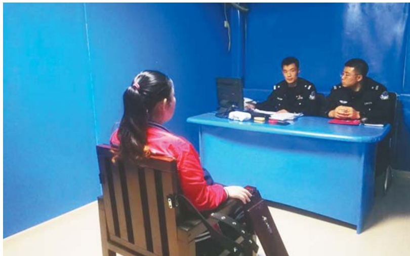
曹某某近日被黄岛警方抓获。

曹某某今年41岁,高密市人。2017年3月,曹某某在青岛西海岸新区租赁写字楼,悬挂所谓“东方九道国际控股有限公司”的牌子,并注册网站,采取三级分销代理的模式,鼓吹投资能够获得高额返利,吸引全国各地的人投资。曹某某所创办公司销售的产品包括虾青素、空气净化器、