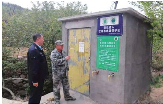
开展饮用水水源地综合整治行动。

城阳区涉及全省贫困村饮用水源地保护项目有2个,分别为:棉花社区水源地(水塘)和下山色峪水源地地下水井。棉花社区水源地(水塘)位于城阳区惜福镇街道棉花社区,下山色峪水源地地下水井