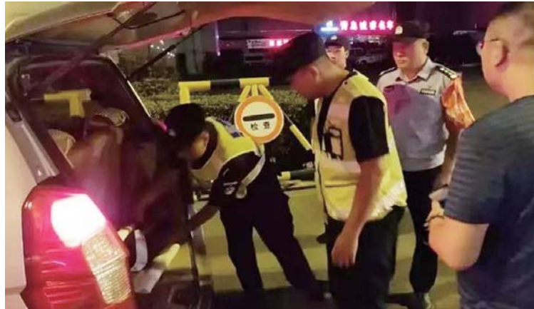
公安检查站盘查车辆。

记者了解到,当晚共出动警力1100余人,车辆130余辆,部署集中抓捕组35组,治安清查组46组,公安检查站2处,交警夜查点11处。集中行动共抓获各类违法犯罪嫌疑人72人;清查各类场所和治安复杂区域1000余处,核录人员4400余人,抓获违法犯罪嫌疑人40余人,