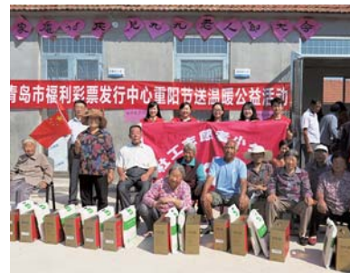
青岛市福彩中心给老人们送来节日礼物。