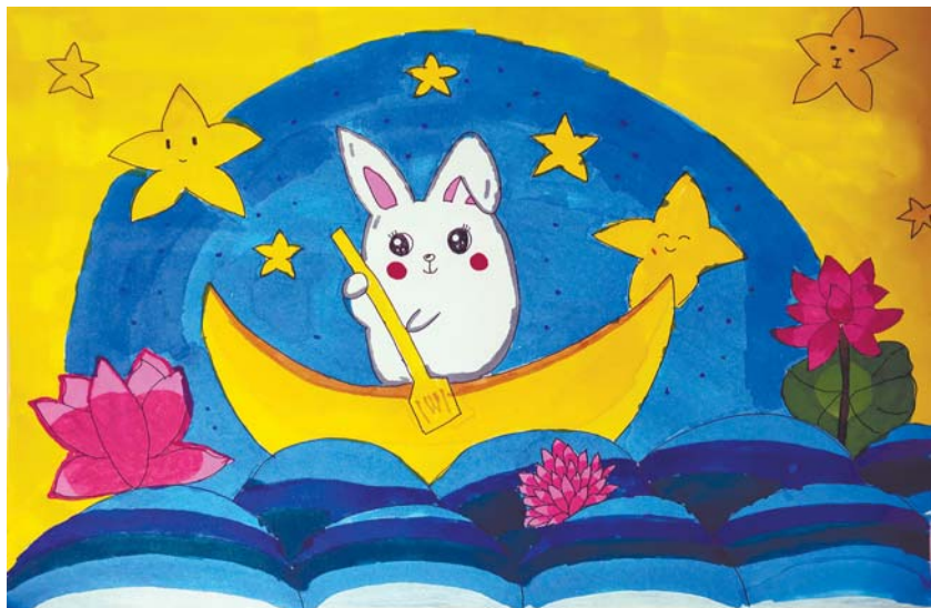
城阳区实验小学 一年级12班 臧若晴 指导教师:王岩