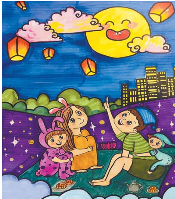
◀城阳区国城小学 三年级12班 张子瑶