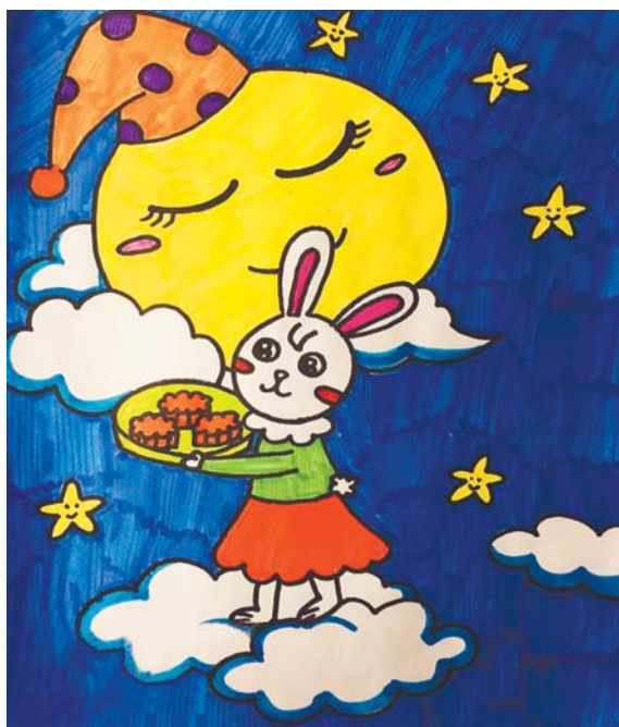
◀城阳区实验小学 一年级12班 刘馨然 指导教师:王岩