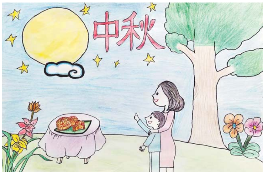
城阳区实验小学 二年级12班 胡袁硕 指导教师:贺名竹