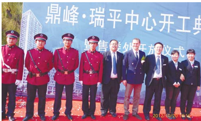
▲ 管辖服务 鼎峰·瑞平中心项目。