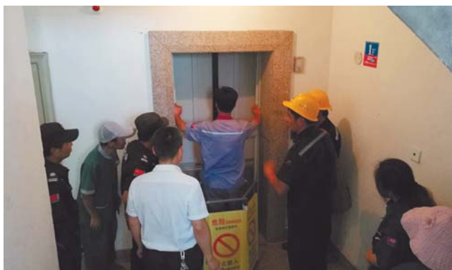
▲ 及时排除电梯故障。