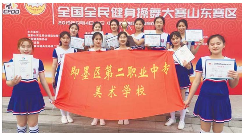
学生获第八届全国全民健身操舞大赛特等奖。

“优秀教师”“优秀班主任”“学生最喜爱的老师”等评选活动，引领教师爱岗敬业，潜心从教。一年来，先后有2人被评为“全国优秀辅导教师”，1人被评为“青岛市教育学会先进工作者”，1人被评为“青岛名师”，1人被评为青岛市学科带头人，2人被评为青岛市教学能手，1人获青岛市优质课比赛一等奖，6人获即墨区优秀青年教师称号等。