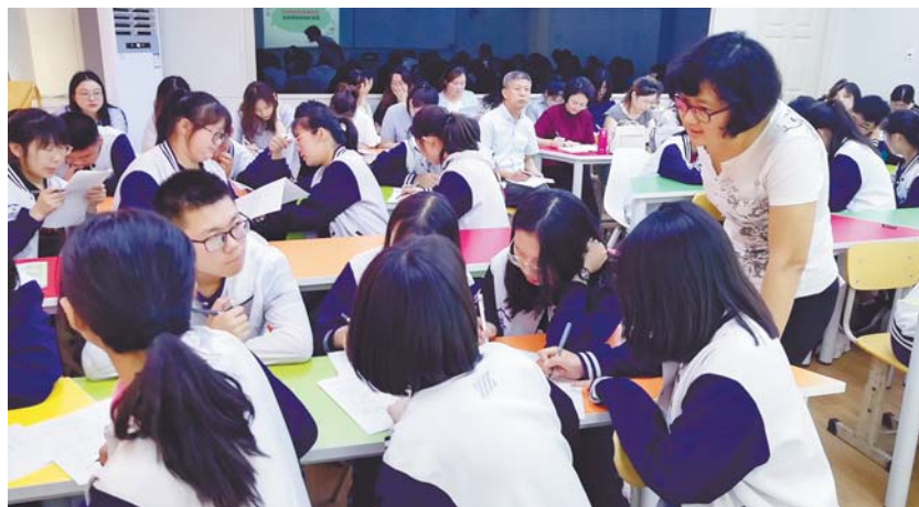
即墨区高中语文教研活动。