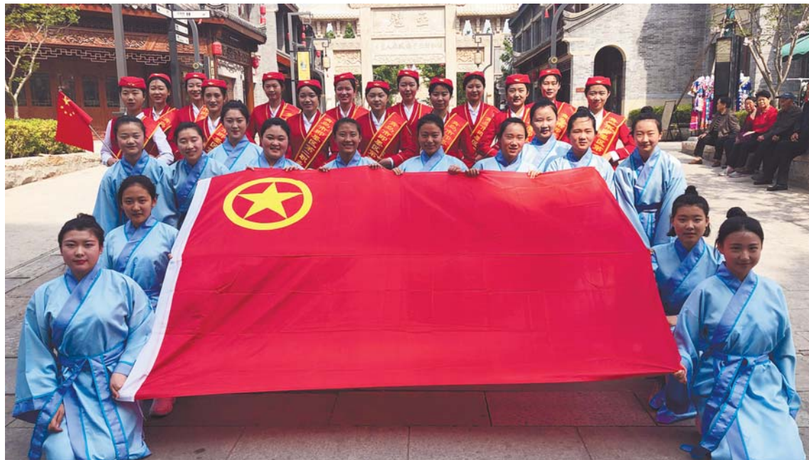
学生社团开展志愿服务活动。

2人获全国职业技能大赛银牌，2人被中央美院录取，科技社团获青岛市头脑奥赛第一名、全国头脑奥赛二等奖，毕业生优质就业率继续保持在95%以上，连续多年蝉联年度综合考核一等奖，群众满意度节节攀升……2019年，即墨二职中专不忘初心，砥砺前行，交出了一份特色发展、硕果累累的靓丽答卷。