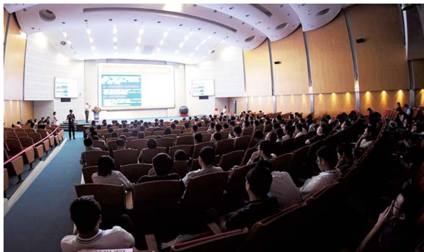
展会期间举办高端论坛。