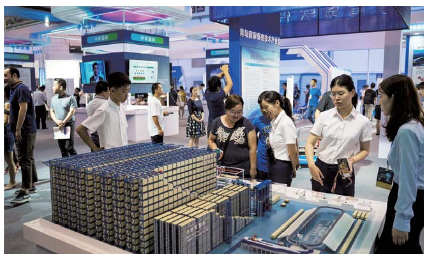
展会现场处处可见高科技产品。

用区市联动形式,现场设置了智慧城市数字文化创意、区块链信息安全、虚拟现实IC设计通信技术7大主题展区,集中展示全市软件产业发展成果和区市特色产业优势。委托青岛市软件行业协会负责国际知名企业的招展及发布对接交流会等工作,协会通过与浙江、江苏、上海等12省市的软件行业协会联动,发挥行业协会的桥梁作用,组织各省市上市企业、百强企业以及软件名城的55家优秀软件企业组团参加展会。