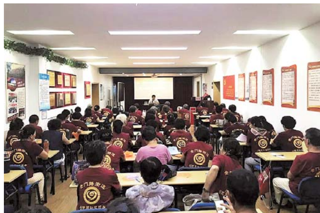
志愿服务专题培训活动。

此次志愿服务培训班是4S服务队为更好服务居民群众、不断提升队员水平和素质的一项重要举措。接下来,4S服务队还将坚持服务“身边有需要的人”,将志愿服务进行到底。