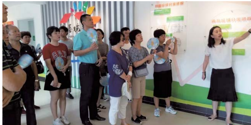
参观市南区垃圾分类宣教中心。